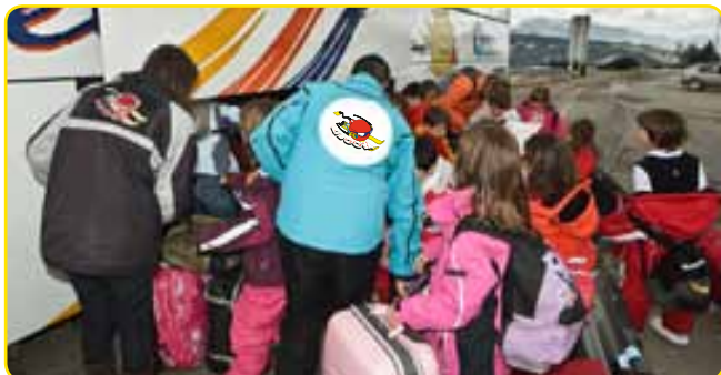
Assistència d'un monitor a la sortida de l'escola (coordinació)