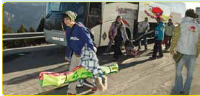
A l'arribada del grup, assistència dels monitors per anar directament a agafar el material d'esquí