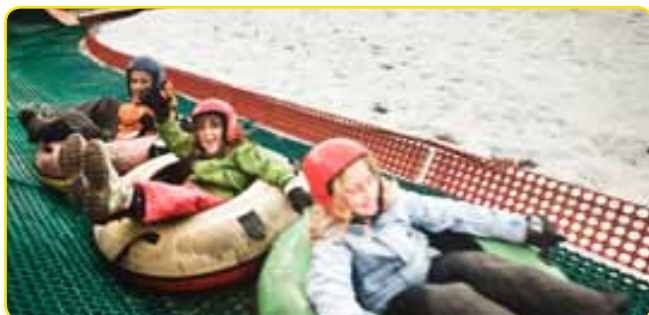
Circuit de tubbys amb l'assistència dels monitors de lleure (única activitat no inclosa)