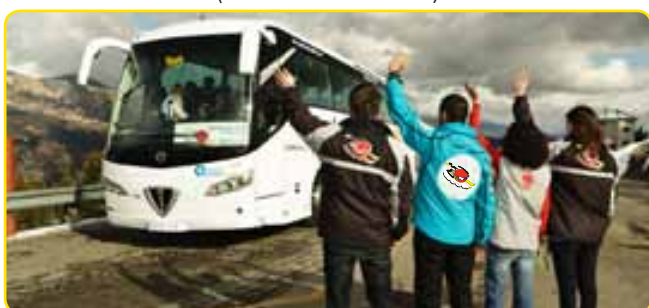
A l'hora acordada, assistència dels nostres monitors el dia de la sortida cap a casa