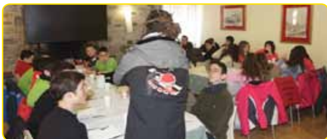
A l'hora de dinar i sopar, assistència dels nostres monitors de lleure

Un grup de monitors de lleure especialitzats, estaran durant tota la estància fent activitats abans i després de sopar, un cop finalitzades les classes d'esquí (trineus, tir amb arc, karaoke, xocolatada, discoteca...)