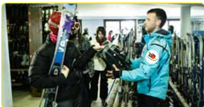
Lloguer de material a peu de pistes sense esperes. Amb l'ajuda dels monitors d'esquí, entrega del material

Dedicació absoluta als alumnes, oferint un aprenentatge d'esquí de qualitat amb la possibilitat de practicar el snow board, dirigit pels millors professionals en neu. Estem durant tota la jornada i només arribar ja comencem!!!