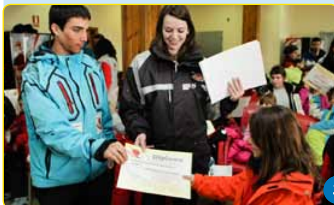
Al final de l'estància entrega de diplomes